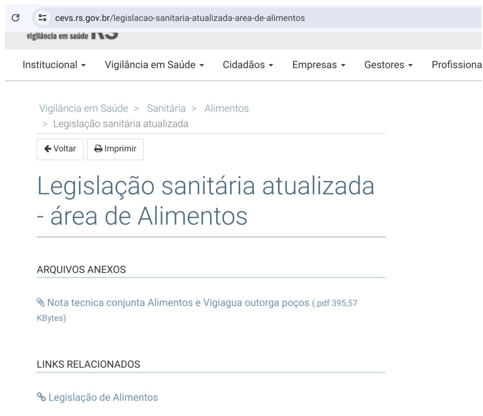
Figura 5 - Legislação sanitária atualizada - área de Alimentos, CEVS RS.