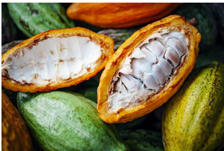
Imagem 2: Fruto do Cacau

A produção global é concentrada principalmente na África, responsável por cerca de 70% do total, com destaque para a Costa do Marfim, que sozinha responde por quase 40%. A Ásia contribui com aproximadamente 17% e as Américas com 13% (PARADA, 2024). Além da importância das amêndoas para a indústria do chocolate, outros derivados — como nibs, cacau em pó, manteiga de cacau, mel de cacau e subprodutos fermentados — apresentam crescente relevância econômica (BRANDÃO, 2021; HENZ et al., 2021).