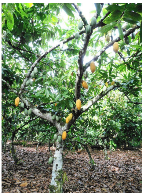
Imagem 1: Cacaueiro

O nome científico da planta, Theobroma cacao , deriva do grego “ theo ” (deus) e “ broma ” (bebida), referência à importância cultural atribuída ao cacau por povos pré-colombianos, que consideravam sua bebida sagrada (HENZ et al., 2021; PARADA, 2024).