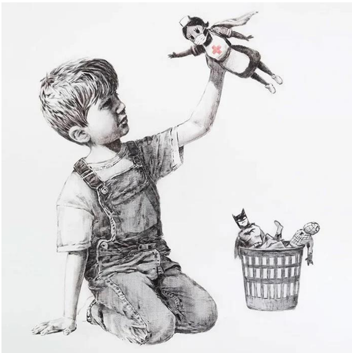
“Game Changer”(Banksy 2020)

Significando o cuidado na Pandemia COVID-19