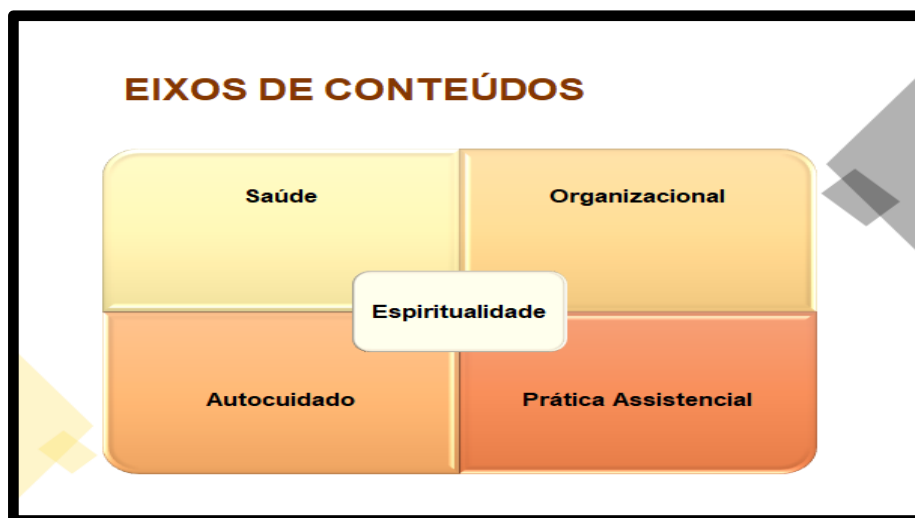
Figura 3 - Eixos de conteúdos